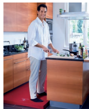
Federleicht gesund kochen.