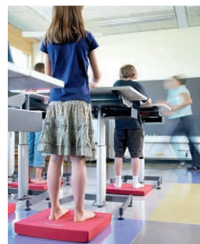
Konzentrierter und federleicht lernen.