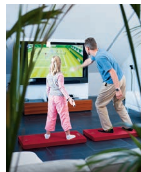
Mehr Spaß beim Spielen.